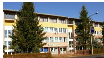
Huszka Hermína Általános Iskola Örkény