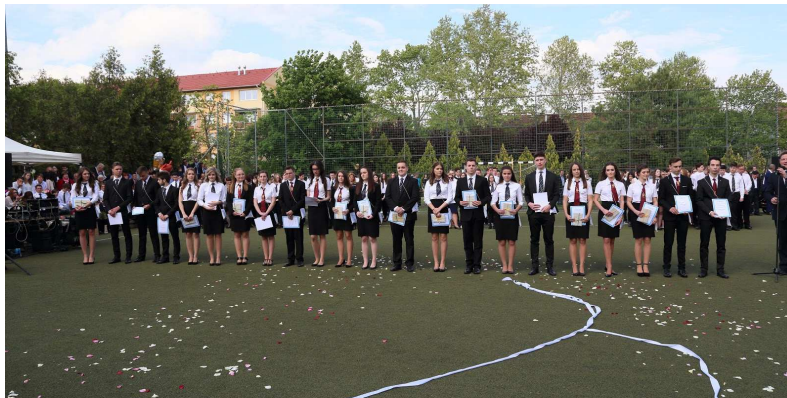
4. kép: huszonkét tanulónk vehette át a Pro Lingua-díjat

3. kép: egy az öt Kiváló SportEMBER közül