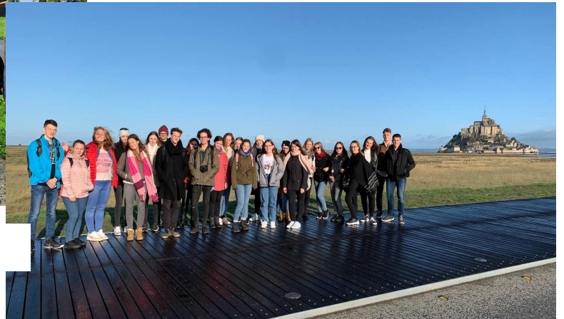
11. ábra: a Planetáriumban és a Mont-Saint-Michelle Apátság felé