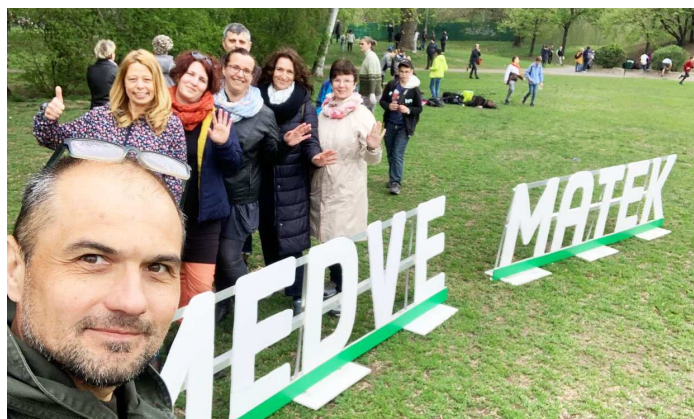
10. kép: közel 150 diákkal utaztunk Budapestre

Gimnáziumunk újra elnyerte a legtöbb csapatot, és ezáltal a legtöbb diákot delegáló intézmény címét: három tele busszal, közel 150 diákkal – a Táncsics Alapítvány támogatásával - utaztunk Budapestre.