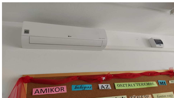
6. kép: új légkondicionáló berendezés a 119-es tanteremben

Az oktatást segítő különböző technikai-és sporteszközök beszerzése, az informatikai eszköze fejlesztés is kiemelt feladata lett a Táncsics Alapítványnak.