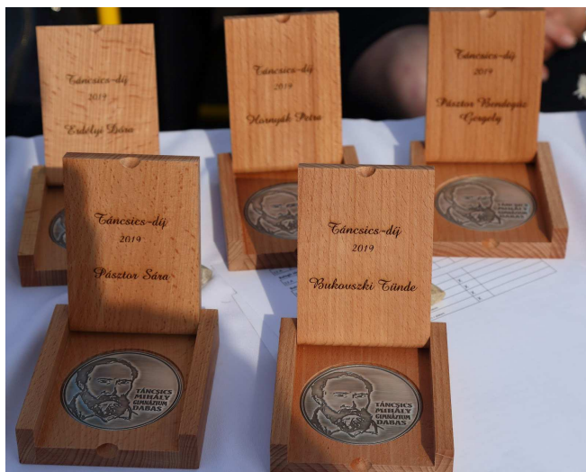
2. kép: a Táncsics-plakettek 2019-ben

Táncsics Díj: a gimnázium falai között eltöltött négy, öt, illetve nyolc év alatt kiemelkedő tanulmányi-, közösségi- és sportteljesítményért járó kitüntetés, melyből évfolyamonként egyet ítél oda az Alapítvány kuratóriuma az osztályfőnökök javaslatai alapján. A Táncsics Díj átadására a ballagási ünnepségen került sor. 2019.