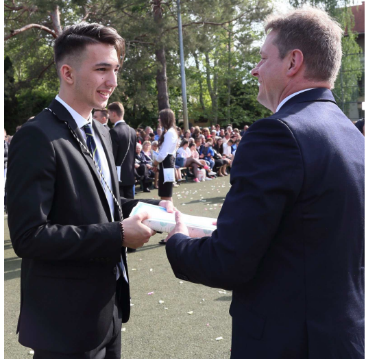
3. kép: egy az öt Kiváló SportEMBER közül

A díjat az osztályfőnökök és a testnevelési munkaközösség javaslatai alapján, a ballagáson azok a végzős diákok kapták, akik mind sportteljesítményükkel mind pedig egész jellemükkel a sport értékeit képviselték úgy a sport területén, mint a mindennapokban, és így bizonyultak a legkiválóbbnak. 2019-ben a díjat öt tanulónk vehette át.