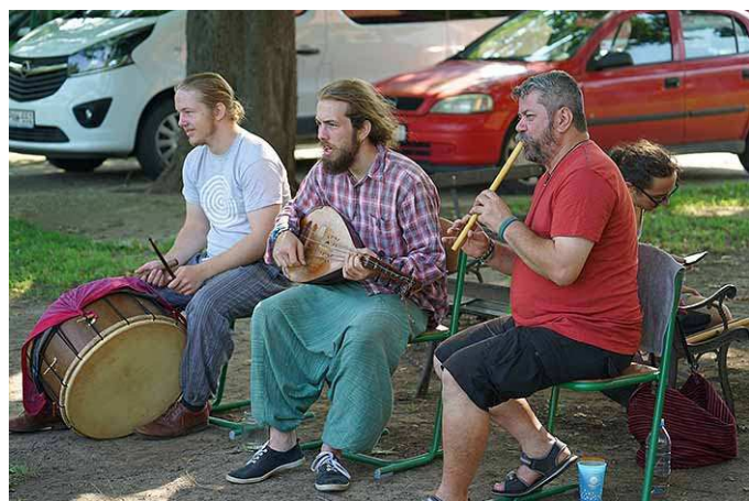
11. kép: munkában a zenekar a XV. Szent László Néptánc táborban

Második alkalommal került megszervezésre a Szent László Néptánc tábor a Miniszterelnökség támogatásával közösen közel száz kárpát-medencei fiatal részvételével a Felvidékről, Kárpátaljáról, Erdélyből, a Délvidékről, Horvátországból és a Muravidékről.