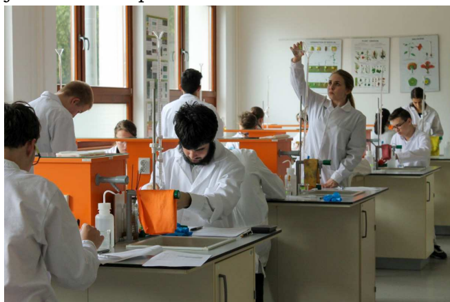
1. kép: a Irinyi János Középiskolai Kémiaverseny Pest megyei fordulója az Öveges József Természettudományos Központban

2019-ben is több házi versenyt szerveztünk az alapítvány támogatásával: angol és német nyelvi versenyt, történelem és természettudományos tantárgyakból. Minden évben iskolánkban kerül megrendezésre a Pest Megyei Történelmi Verseny , a térségi Trianon-vetélkedő , az Irinyi János Középiskolai Kémiaverseny Pest megyei fordulója, amely szervezésében, lebonyolításában, díjazásában az alapítvány jelentős szerepet vállal.