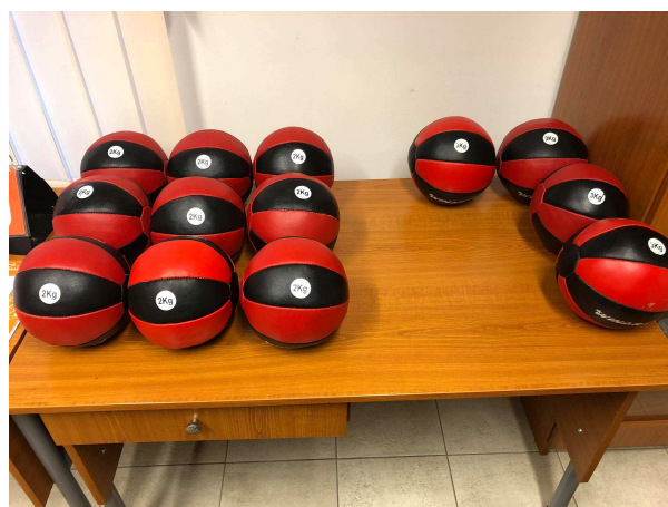
5. kép: az új medicin labdák a testnevelés órák kellékei

2019-ben egy újabb tanterembe került légkondicionáló berendezés a szülők és az alapítvány közös teherviselésével.