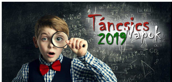
7. ábra: a Táncsics-napok plakátja

Szabadidős programokra: gólyabál, Mikulás-nap, karácsonyi ünnepség, farsang , szülők bálja, Táncsics-napok, Diákolimpia, nemzeti ünnepek, iskolai megemlékezések.